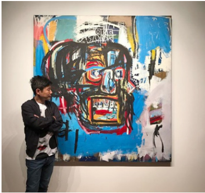
1. Жан-Мишель Баския «Без названия» (1982) Цена продажи 110,5 млн долл.

Сезон торгов в аукционном доме Sotheby's закрывается аккуратно под Рождество, и к этому же времени подводятся итоги уходящего года. Надо заметить, что для Sotheby's он был довольно прибыльным: арт-рынок снова пошел вверх, и в своем отчете аукционный дом сообщил о росте оборота на 13 %, а общий объем торгов составил 4,1 млрд долл.