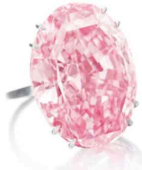
2. Бриллиант Pink Star (59,6 карата) Цена продажи 71,2 млн долл.

В целом же картина очень типична для творчества Баския периода 80-х годов, а узнаваемость – один из важных факторов, влияющих на цену. Кроме того, смерть в 27 лет положительно повлияла на стоимость работ, как бы цинично это ни звучало.